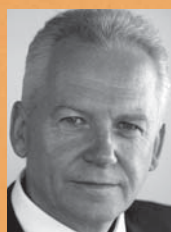
Dr. Rüdiger Grube, Deutsche Bahn AG